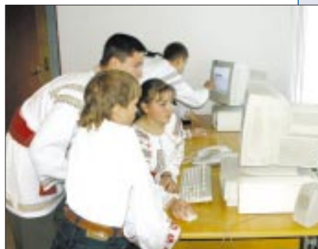
Centrul de Informație și Acces la Internet din c. Lăpușna

Răspunsurile la această situație s-ar putea regăsi într-un angajament politic al țării, lupta cu sărăcia fiind una dintre priorități. „Reducerea sărăciei este un scop care trebuie să ne unească pe toți”, afirmă Președintele Republicii Moldova.