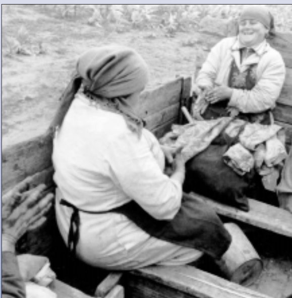
Imagine: Jason Eskenazi