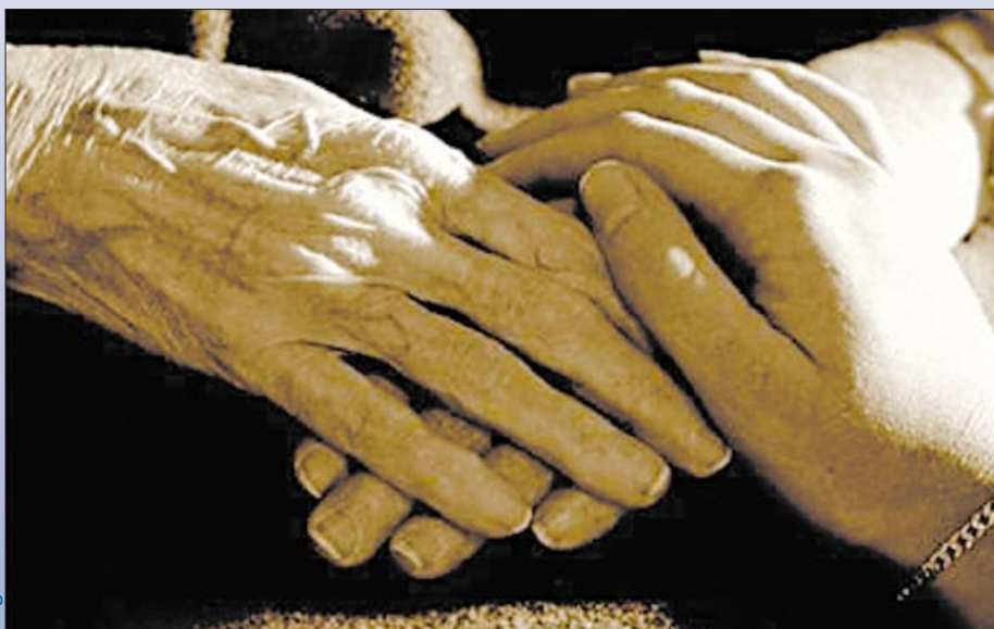
Imagine: Lasse Pettersson