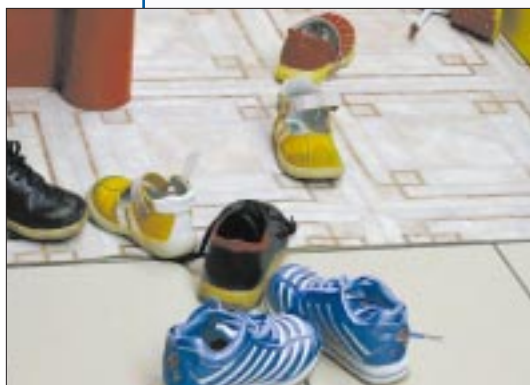
Imagine: Z. Gego