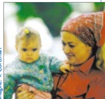
Imagine: V. Corcimari